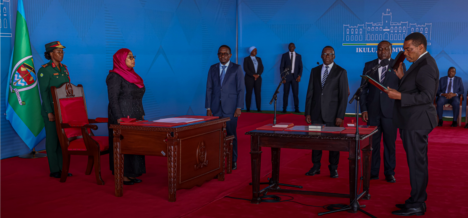
Rais wa Jamhuri ya Muungano wa Tanzania, Mheshimiwa Dkt. Samia Suluhu Hassan, akimuapisha Dkt. Mwigulu Nchemba kuwa Waziri Mkuu wa Jamhuri ya Muungano wa Tanzania, Chamwino Ikulu jijini Dodoma Novemba 14, 2025.