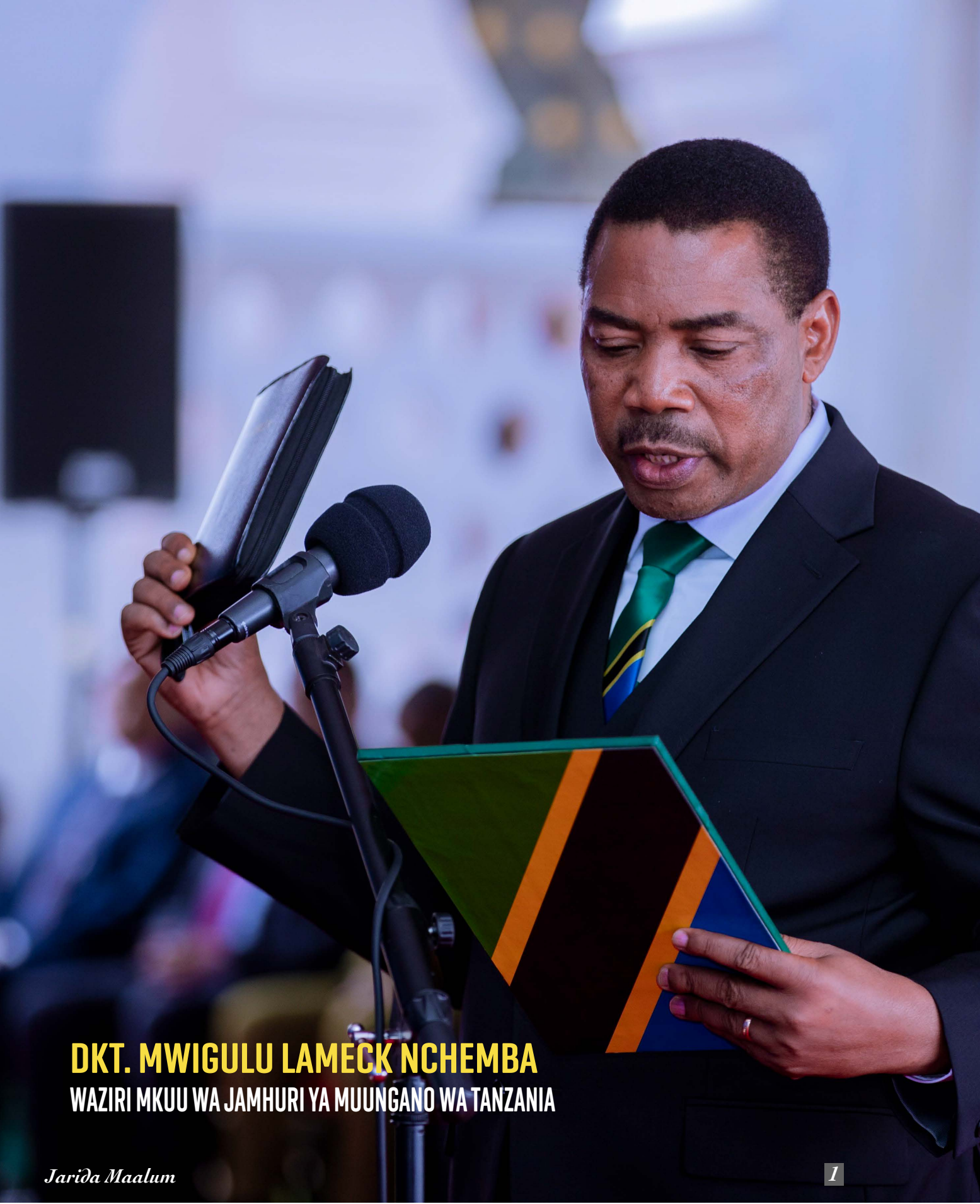
DKT. MWIGULU LAMECK NCHEMBA WAZIRI MKUU WA JAMHURI YA MUUNGANO WA TANZANIA